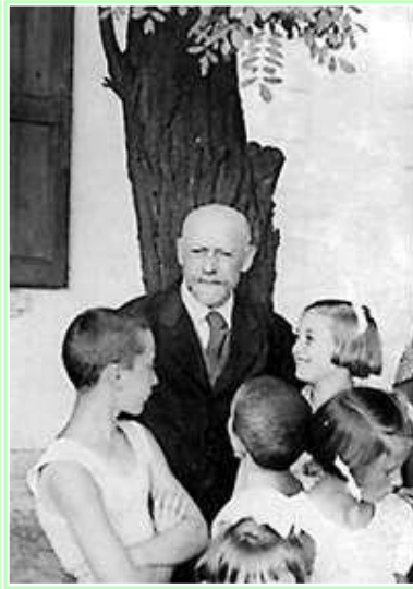
Korczak mit Kindern im Hof des Waisenhauses, in Warschau