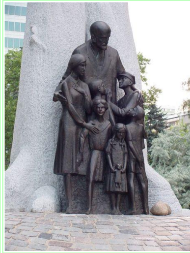
Das Korczak-Denkmal in Warschau, Polen